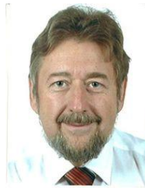
Andreas Keck Ing.-Büro für Prozessorganisation